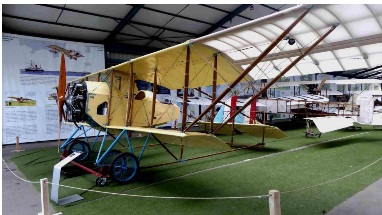
Caudron GIII, conçu en 1913, copie sur plans réalisée en 1994 En avril 1921, Adrienne Bolland franchit la Cordillère des Andes avec un GIII