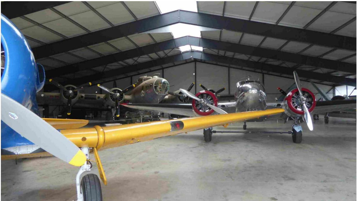
Au fond à gauche, une forteresse volante B17, à droite un Beech D18 S