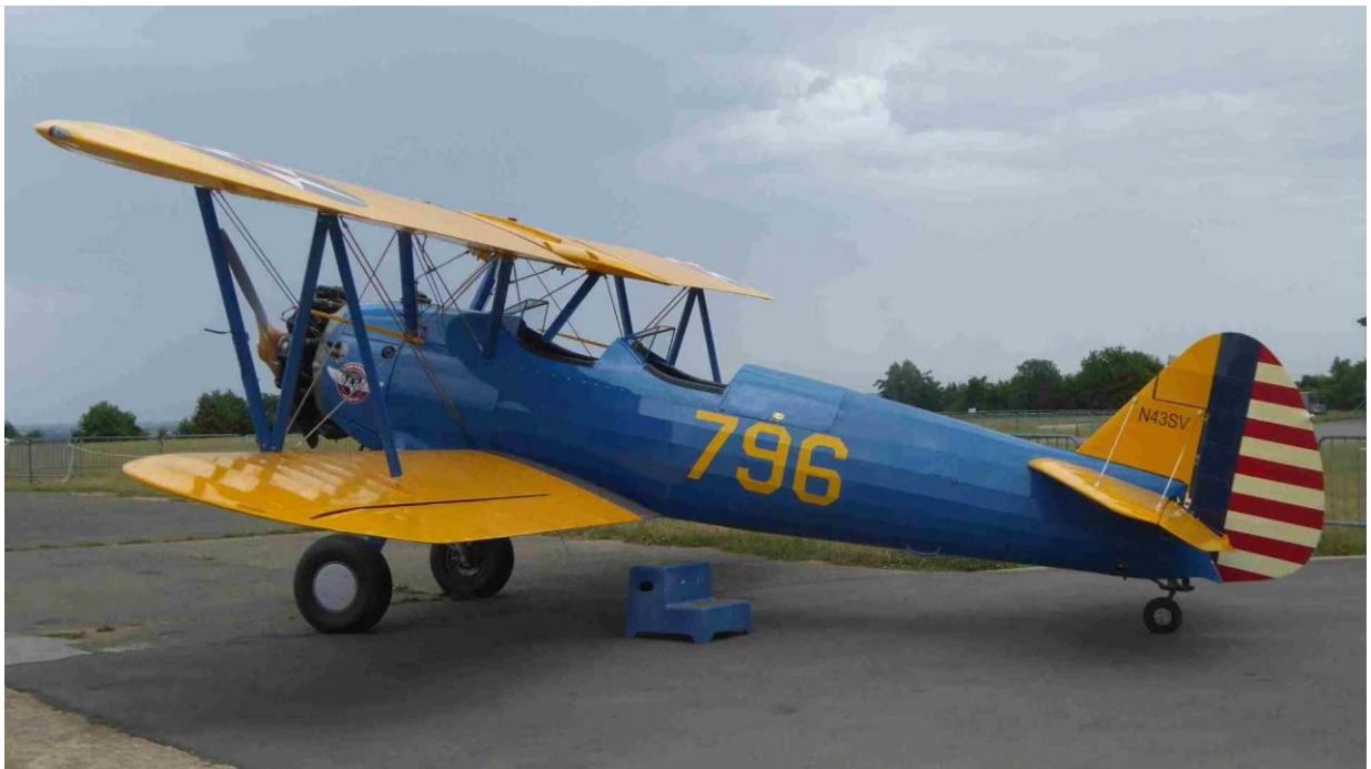
Boeing Stearman, conçu en 1933. Cet exemplaire sert actuellement en école pour la voltige et les baptêmes de l'air.