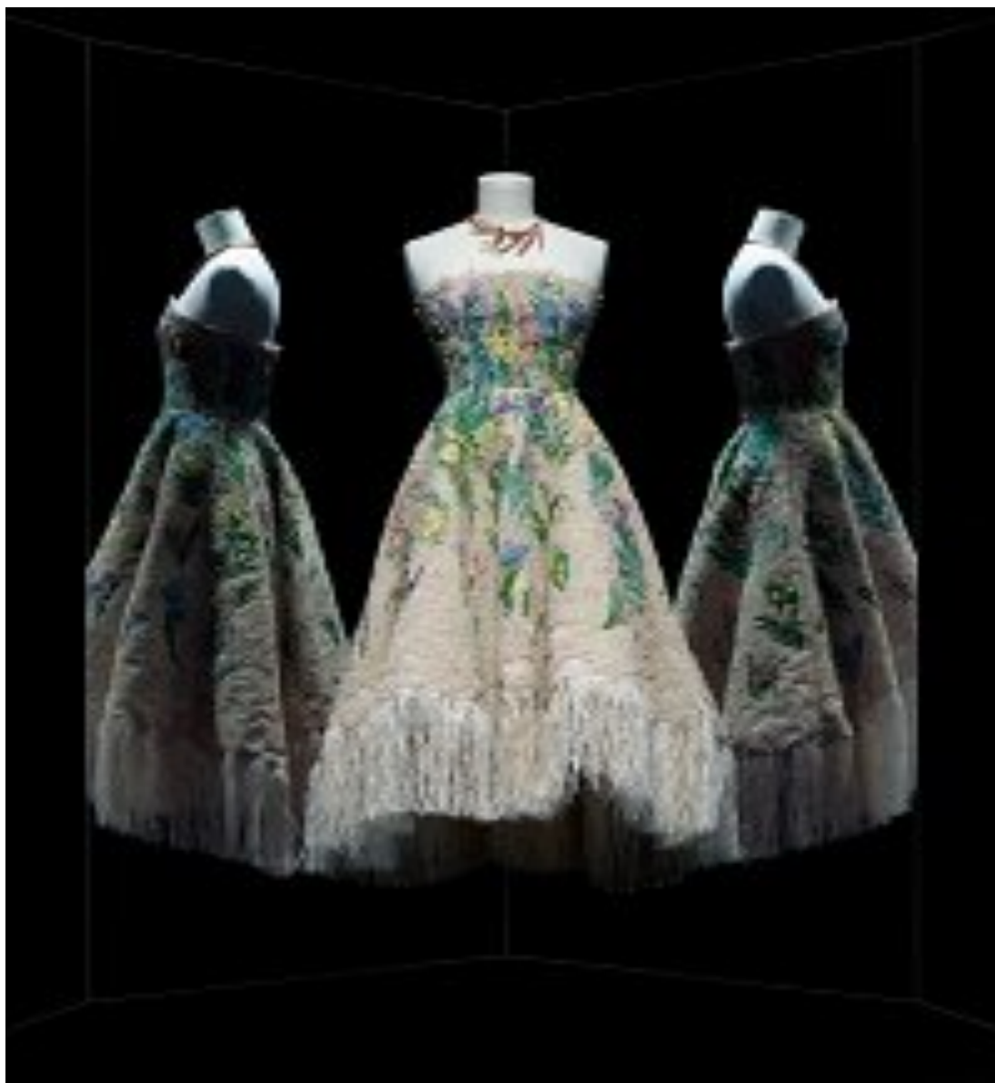
Maria Grazia Chiuri pour Christian Dior, robe Essence d'herbier, haute couture printemps-été 2017

Mais la permanence de l'esprit de Christian Dior tient aussi aux différents directeurs artistiques qui ont pris la relève du couturier après sa disparition en 1957. Une succession de six galeries leur est dédiée pour décrypter comment leur propre création s'inscrit dans la poursuite de cette vision de la haute couture.