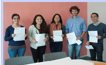
Remise des chèques de bourse en octobre 2014